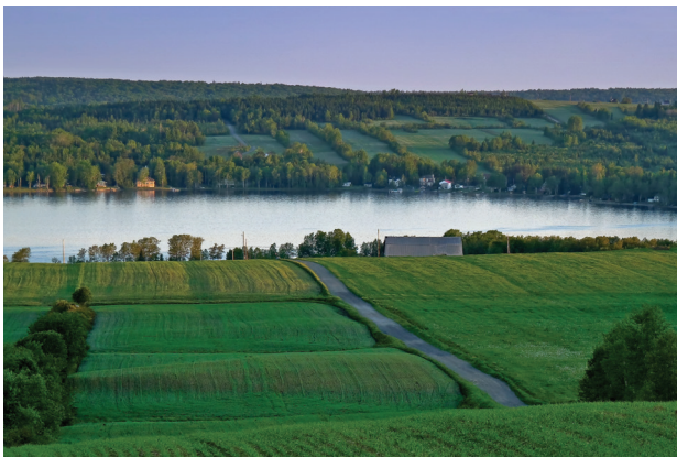
Lac de la Grande Fourche

Municipalité nichée dans les collines appalachiennes, son relief vallonné, typique des monts Notre-Dame, est ponctué de petits et grands lacs. Saint-Hubert-de-Rivière-du-Loup est reconnue pour la beauté de ses forêts, la richesse de ses terres agricoles et ses trois lacs emblématiques, soit le lac de la Grande Fourche et son camping municipal, le lac Saint-Hubert et le lac Saint-François.